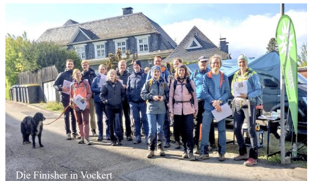
Die Finisher in Vockert

Um 10:00 Uhr starteten dann die Wandergruppen 1+2