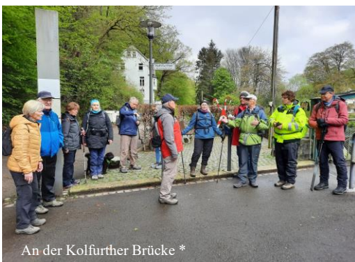
An der Kohlfurth-Brücke *

ebenfalls am Gräfrather Markt bei leichten Nieselregen. Die Gruppe 1 mit der Etappe 1: Gräfrath-Kohlfurth (ca. 6,7 km.) und die Gruppe 2 mit den Etappen 1+2 zusammen von Gräfrath-Kohlfurth-Unterburg (ca. 15 km.). Bei