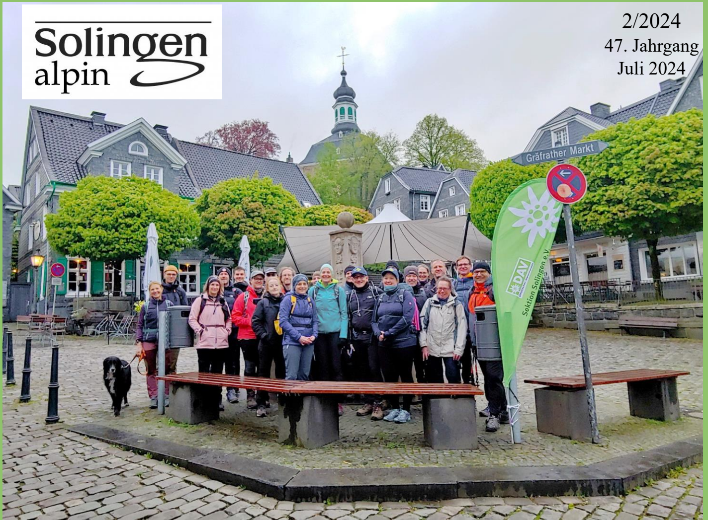
DAV Sektion Solingen: Gemeinsam auf dem „Klingenpfad 2024“ mit den Etappen 1-5 unterwegs